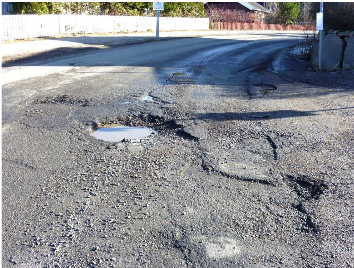
Brennaveien i krysset med Smalåkeren våren 2012.

Oslo kommune har et svært begrenset ansvar for vedlikeholdet av veiene på Brenna. Det kan ikke aksepteres at den eneste kommunale veien vi er avhengig av forsømmes slik det her er gjort i mange år. I fjor var det hull som var så store at den som kom til å kjøre ned i garantert ville fått skade på bilen (Brennaveien ved krysset med Smalåkeren, se bildet under). Bortsett fra strekningen fram til Bilittkroken, som ble lagt ny i forbindelse med legging av fjernvarmerør for noen år siden, er Brennaveien nå full av hull og sprekker og det er nødvendig å kjøre sikk-sakk for å unngå å smelle ned. Vi venter med gru på å se hvordan Brennaveien vil være til våren.